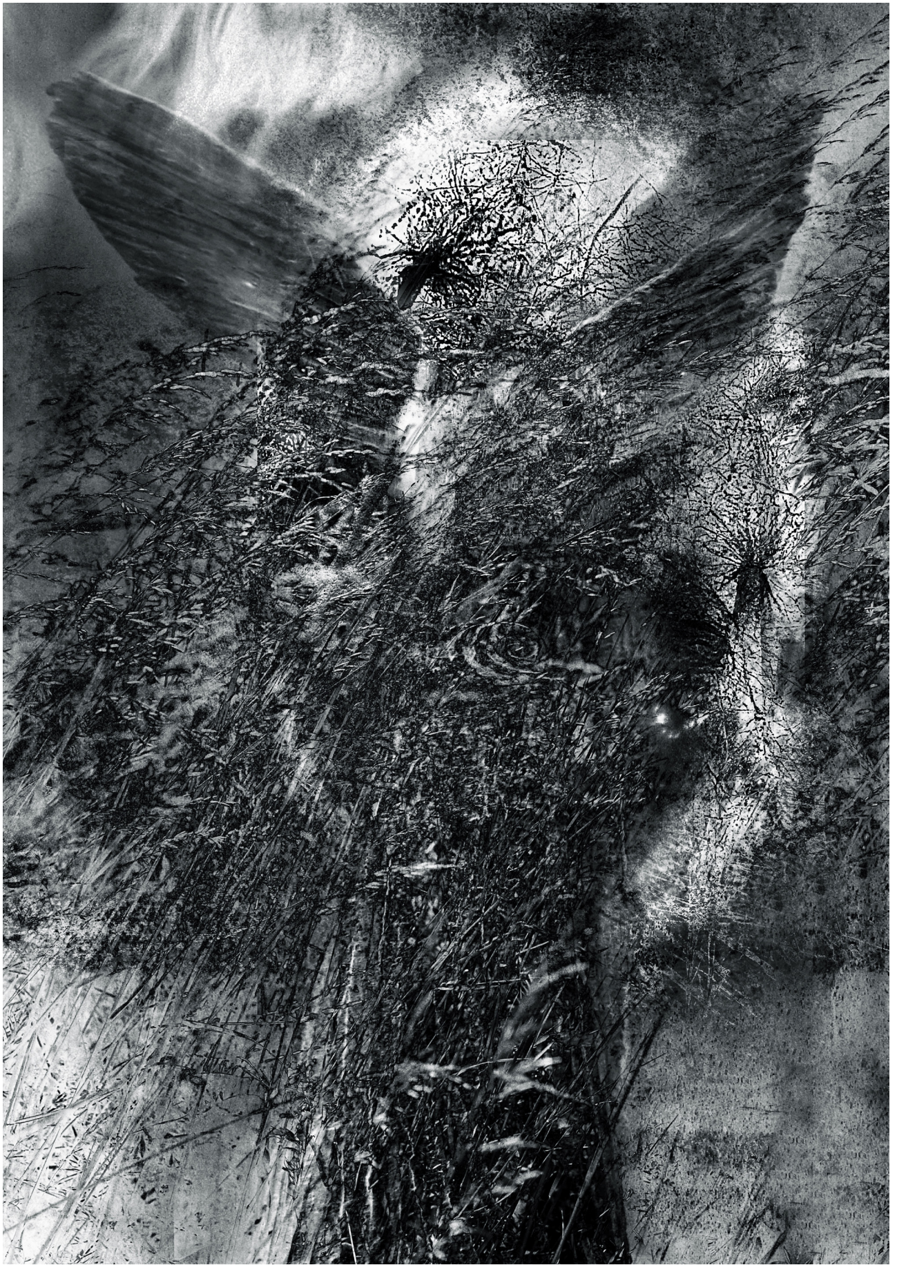
Vladimír Havran Smýkal