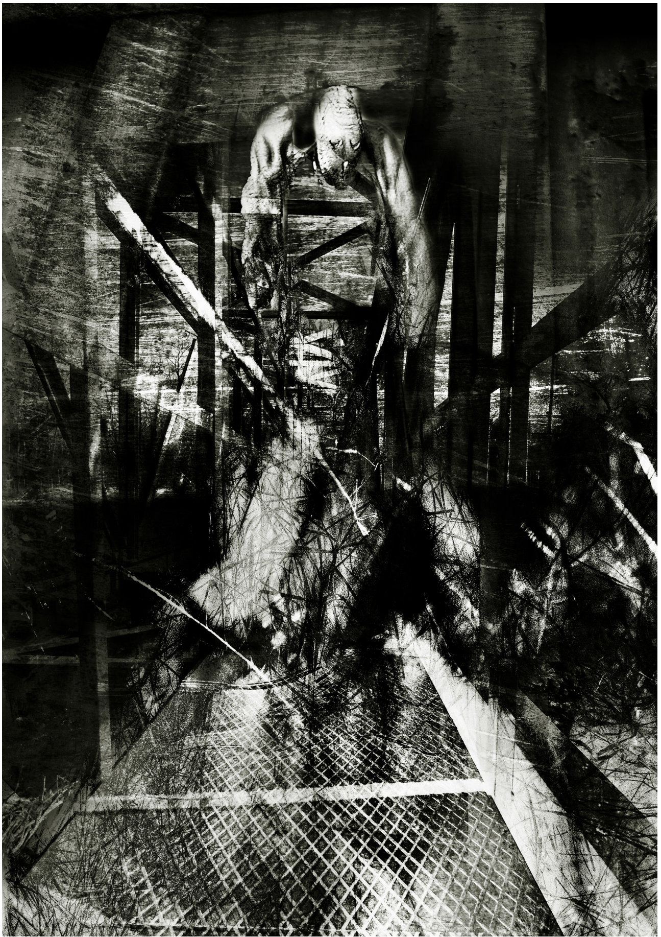
Vladimír Havran Smýkal